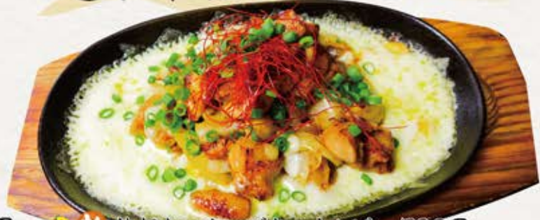
丹 丹 新 韓国風辛味噌幅広麺 880円