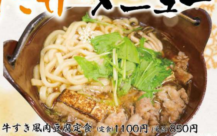
推 牛すき風肉豆腐定食 (定食1100円 (単品)850円)

牛肉と焼き豆腐、うどんなどを入れてすき風の風に仕上げた、ご飯が進む一品です。ご飯味増し玉子、漬物付です。