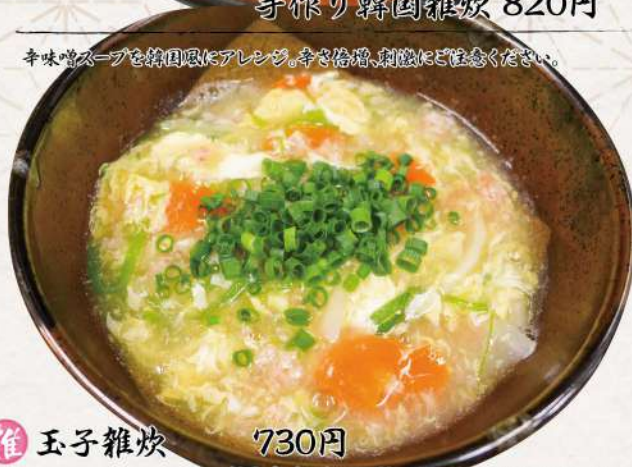
推 玉子雑炊 730円 (幅広麺もお選びいただけます) 塩白湯幅広麺 780円