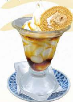
推 白玉黒みつ サンデー 490円

黒蜜と相性のいい生乳ソフトのサンデーです。白玉と黒糖ロールケーキもトッピングした和なサンデーです。