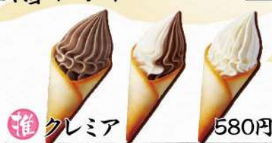
推 クレミア 580円

素材にこだわった上質なソフトクリームです。 ・クレミア ・クレミアミックス ・クレミアチョコ