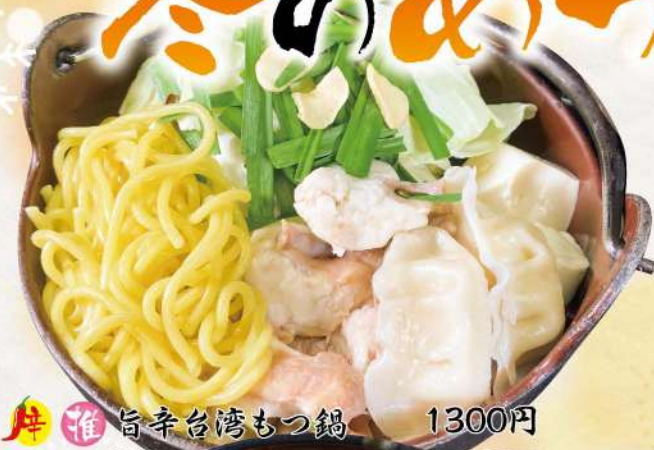
推 旨辛台湾もつ鍋 1300円