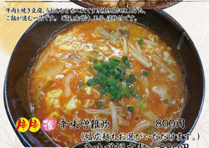
推推推 辛味噌雑炊 800円 (幅広麺もお選びいただけます) 辛味噌幅広麺 880円