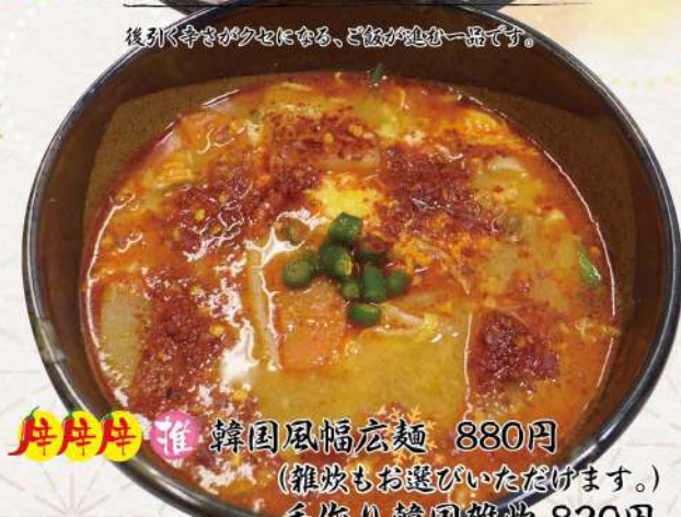
推推推 韓国風幅広麺 880円 (雑炊もお選びいただけます) 手作り韓国雑炊 820円

牛肉と焼き豆腐、うどんなどを入れてすき風の風に仕上げた、ご飯が進む一品です。ご飯味増し玉子、漬物付です。