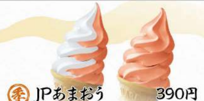
推 JPあまおう 390円